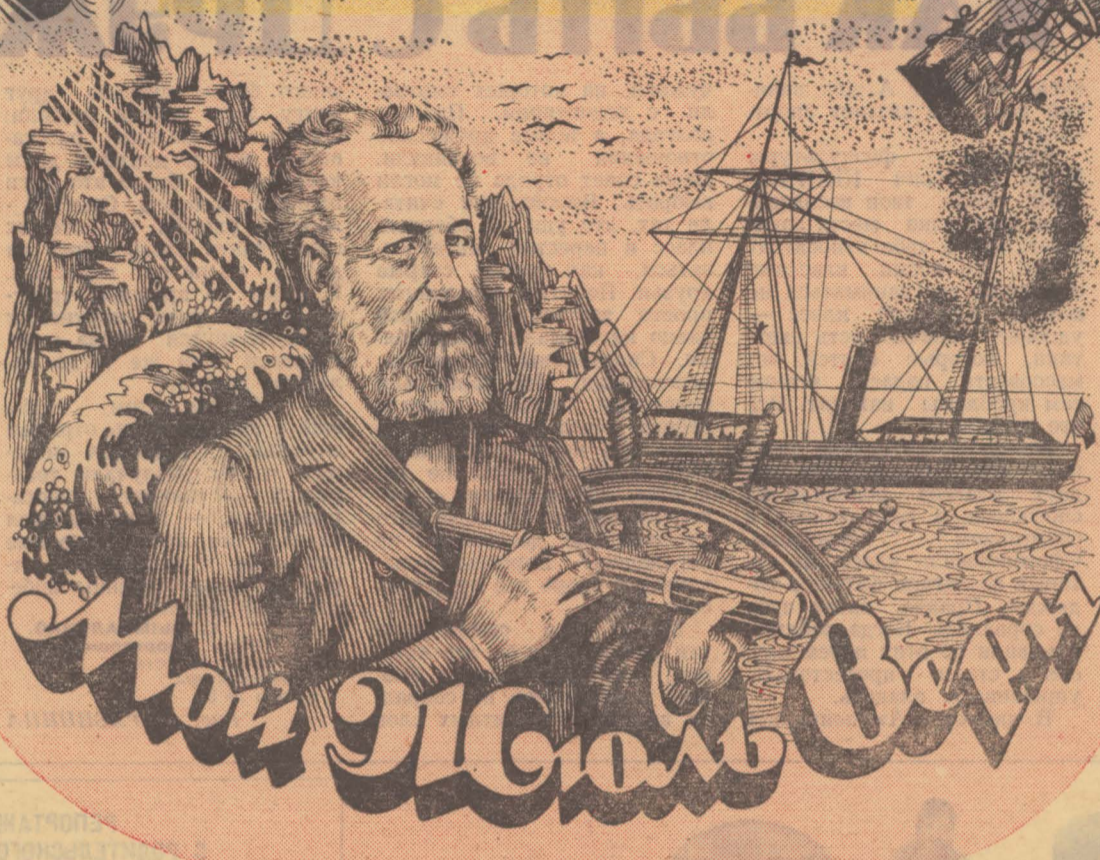
150 лет со дня рождения ЖЮЛЯ ВЕРНА (1828—1905 гг.)

Я всегда любил этого писателя. И всегда его знал. Во всяком случае я не помню того времени, когда я бы не знал и не любил его. Одно из первых воспоминаний в моей жизни — это чёрно-зелёная обложка: усыпанная заклёпками металлическая туша подводного корабля и оседлавшее её гигантское головоногое.